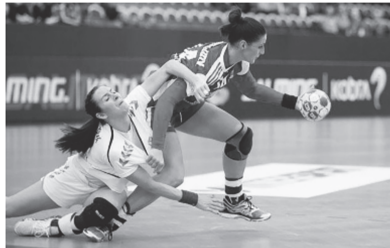
A magyar csapat történelmi vereséget szenvedett a csehektől, az eddigi kilenc összecsapást ugyanis kivétel nélkül megnyerték.

A tornát két vereséggel kezdő magyar válogatott továbbjutott a középdöntőbe a svédországi női kézilabda-Európa-bajnokságon, miután az első szakasz pénteki zárófordulójában 21-14-re legyőzte a montenegrói csapatot (legalább négy góllal kellett nyerni a továbbjutáshoz). Janurik Kinga szenzációs védőteljesítményének hála (32-ből 19-et megfogott, ami fantasztikus, 59 százalékos hatékonyság) Magyarország pont nélkül ugyan, de ott lehet a középdöntőben.