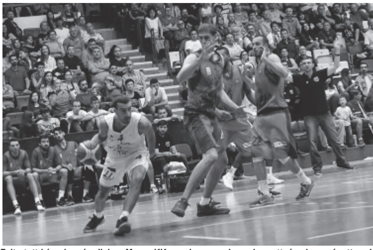
Feltartott kézzel a váradiak, a Maros KK azonban nem kegyelmezett, és visszavágott az 1. fordulójában a Ligetben elszenvedett vereségért (70:76).

Szünet után Kalve is betalált távolról, majd Gajovic büntetője és Barham triplája után megint két számjegyű marosvásárhelyi vezetést mutatott az eredményjelző, de Nagyváradnak sikerült ezt megfelelnie a negyed végére. A házigazdák jó ütemben kosárlabdáztak az utolsó játékrész kezdetén, 2 perc