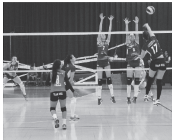
A vendégek az első két szettben a pontjaik 40%-át elrontott marosvásárhelyi nyitásokból szereztek, felépített támadásból a szokásosnál kevesebb babér termett számukra.

A mostani meccsen nagy különbség volt a két csapat között, sokkal nagyobb, mint az eredményből látszana, hisz a vendégek az első két szettben a pontjaik 40%-át elrontott marosvásárhelyi nyitásokból szereztek. Másrészt az előző meccsekhez képest sokkal stabilabb felállást alkalmazott Predrag Zucović. A kezdő